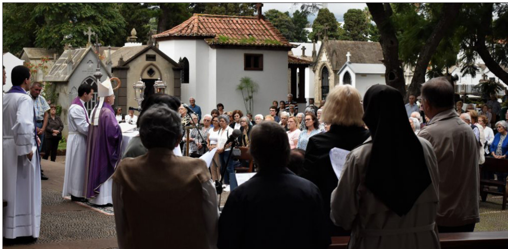
D. Nuno Brás presidiu à Eucaristia no Cemitério de São Martinho

Na quarta-feira, dia 2 de novembro, D. Nuno Brás presidiu a uma Eucaristia no Cemitério de São Martinho por todos os fiéis defuntos.